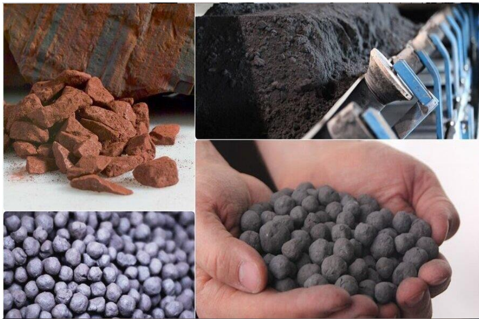
محصولات شرکت: سنگ آهن، کنسانتره، گندله، اسفنجی

شرکت بهار تجارت پارتاک به عنوان تامین کننده سنگ آهن شرکت های بزرگ فولادی بزرگ دارای قراردادهای تامین سنگ آهن به تناژ دو میلیون تن در سال است .